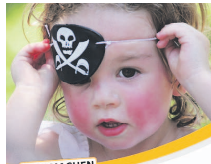
KLARMACHEN ZUM ÄNDERN!

Ihr wollt mehr wissen? Informiert euch auf www.junge-piraten.de .